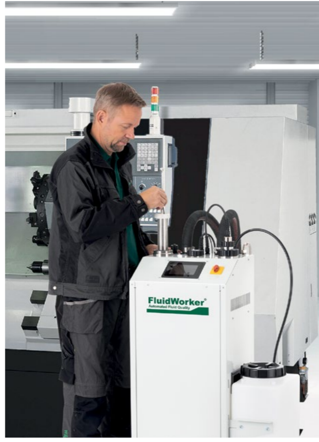
Automatisiertes Flüssigkeitsmanagement durch FluidWorker 150